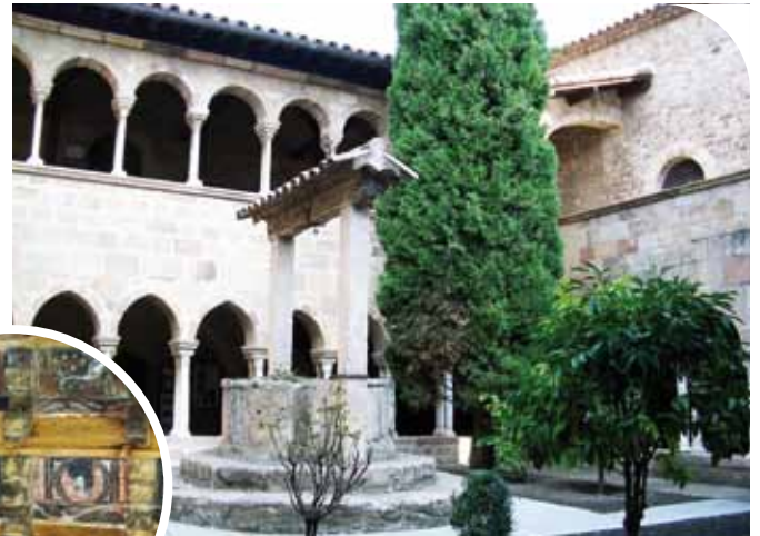
Le cloître de Fréjus. Détail d'un groupe de caissons du plafond médiéval du cloître.

Enfin deux visites à ne pas manquer ! D'une part le circuit Cocteau le mardi de 10 h 00 à 12 h 00 qui vous fera découvrir la dernière œuvre posthume du Prince des poètes au quartier de la Tour de Mare, la chapelle Notre-Dame-de-Jérusalem. D'autre part, l'étonnante crypte archéologique aménagée tout récemment le jeudi à 10 h 00, 11 h 30, 16 h 30 et le dimanche à 16 h 00 et 17 h 30. Elle permet de découvrir un vivier